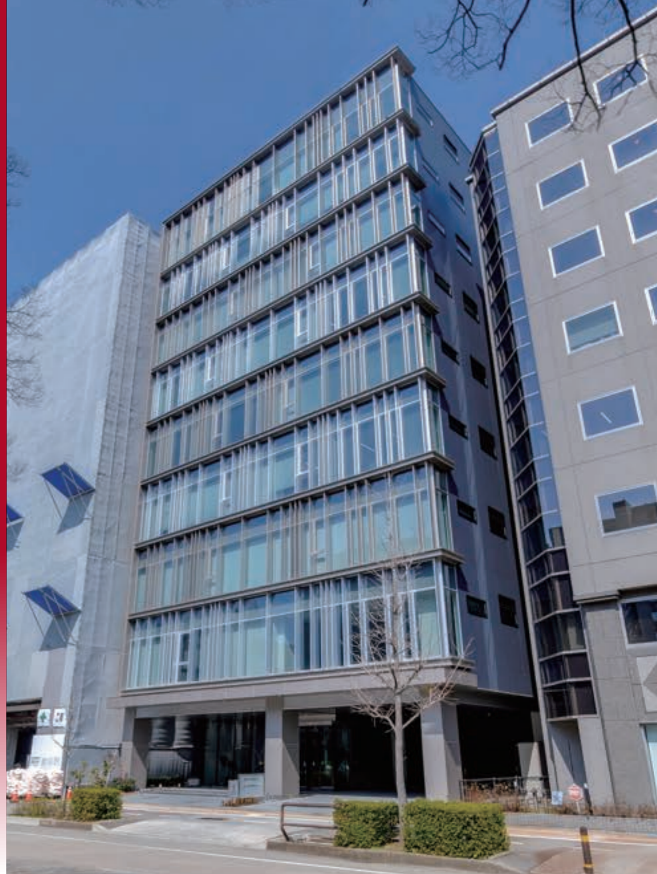
写真右上：建物正面からの外観 写真左下：1階エントランス通路 いずれも2024年2月現在の写真です。

金沢けやき大通りビルはVR内覧も可能です。 詳細は右のQRコードよりご覧下さい。