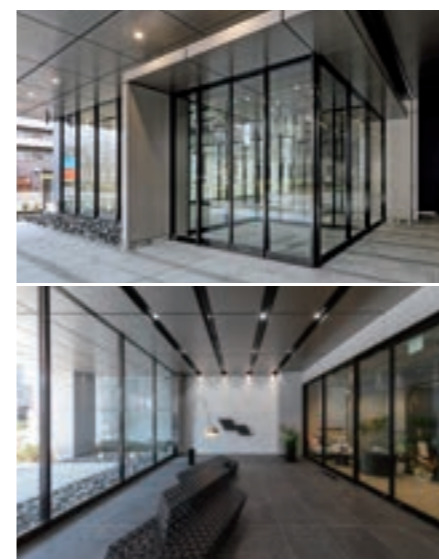
いずれも2024年2月現在の写真です。

北陸新幹線敦賀開業を2024年3月16日に行い、ますます注目が集まる金沢駅周辺エリア。特に西口エリアは2015年北陸新幹線金沢開業前後に多数のビルが竣工し、オフィス街として注目が高まっており、2023年には日本銀行金沢支店が移転済みです。