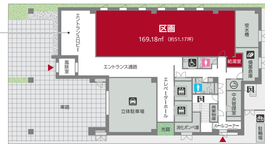
※掲載の完成予想図・間取図は設計図書を基に描き起こしたもので実際とは多少異なる場合があります。